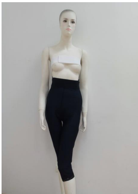
FAJA POR DEBAJO DE LA RODILLA CLG700

Fajas postliposucción disponibles en cuatro longitudes. Las prendas FORMeX se fabrican usando la tecnología Naturexx y Comprexx. El resultado son unas prendas suaves pero compresivas, libres de látex y que incorporan un tratamiento antimicrobiano. El proceso de fabricación optimiza los niveles de compresión para reducir las molestias postoperatorias, posibilitando la circulación natural y mejorando el proceso de curación. Estas fajas se usan principalmente en la fase de recuperación tras una liposucción. Proveen soporte en las áreas operadas para ayudar a la piel a adaptarse mejor a los nuevos contornos. Liberan al cuerpo de fluidos potencialmente peligrosos, permitiendo a la paciente incorporarse a su rutina diaria más rápidamente. El tratamiento antimicrobiano ayuda a retardar el crecimiento de bacterias u hongos que podrían causar olor, irritación de la piel, moho o degradación del tejido. Esta prenda es transpirable, ligera y tiene un tacto sedoso. Incorporan una cremallera con ganchos en los laterales para facilitar su colocación. La cintura es alta y dispone de una cinta elástica para favorecer la autosujección de la prenda. El tejido de la faja no se deforma con el uso o los continuos lavados. Se suministran en color negro.