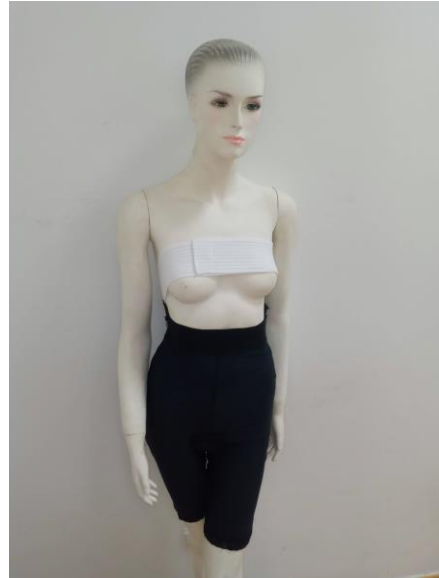
FAJA POR ENCIMA DE LA RODILLA CLG500

Fajas postliposucción disponibles en cuatro longitudes. Las prendas FORMeX se fabrican usando la tecnología Naturexx y Comprexx. El resultado son unas prendas suaves pero compresivas, libres de látex y que incorporan un tratamiento antimicrobiano. El proceso de fabricación optimiza los niveles de compresión para reducir las molestias postoperatorias, posibilitando la circulación natural y mejorando el proceso de curación. Estas fajas se usan principalmente en la fase de recuperación tras una liposucción. Proveen soporte en las áreas operadas para ayudar a la piel a adaptarse mejor a los nuevos contornos. Liberan al cuerpo de fluidos potencialmente peligrosos, permitiendo a la paciente incorporarse a su rutina diaria más rápidamente. El tratamiento antimicrobiano ayuda a retardar el crecimiento de bacterias u hongos que podrían causar olor, irritación de la piel, moho o degradación del tejido. Esta prenda es transpirable, ligera y tiene un tacto sedoso. Incorporan una cremallera con ganchos en los laterales para facilitar su colocación. La cintura es alta y dispone de una cinta elástica para favorecer la autosujección de la prenda. El tejido de la faja no se deforma con el uso o los continuos lavados. Se suministran en color negro.