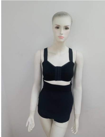
FAJA LONGITUD BIKINI CLG300