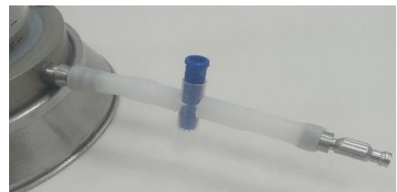
Sistema de extracción de grasa